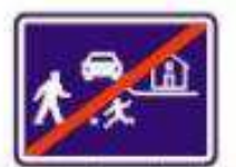
Konec obytné zóny

Vznik obytných zón je reakcí na rostoucí motorovou dopravu - centra obcí pohltily automobily a chodci byli z ulic téměř vytěsněni. Smyslem obytné zóny je přizpůsobení provozu vozidel pobytové funkci přilehlé zástavby. V obytné zóně se všichni účastníci provozu dělí o společný prostor. Pobytová funkce převládá nad funkcí dopravní, což je zdůrazněno jejím stavebním řešením. V obytné zóně platí tyto specifické provozní podmínky stanovené zákonem: